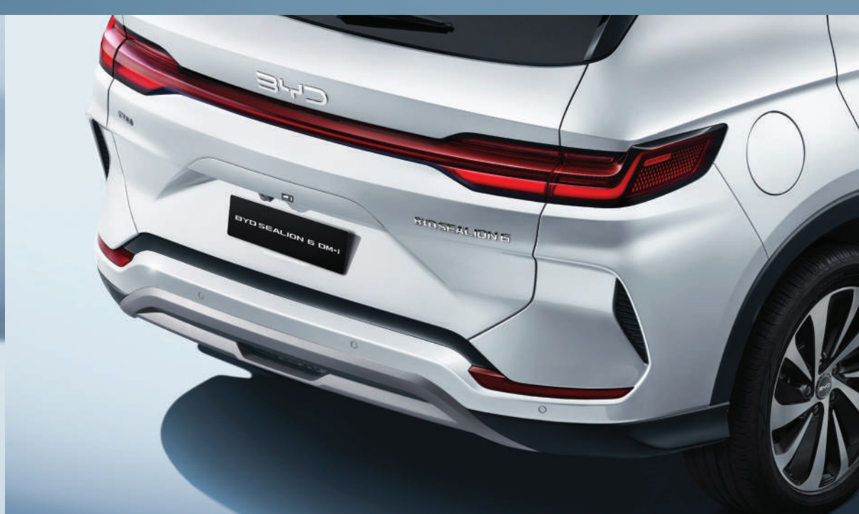
ดีไซน์ไฟเลี้ยวทรงหยดน้ำ พร้อมระบบไฟเลี้ยวด้านหลังแบบ Sequential