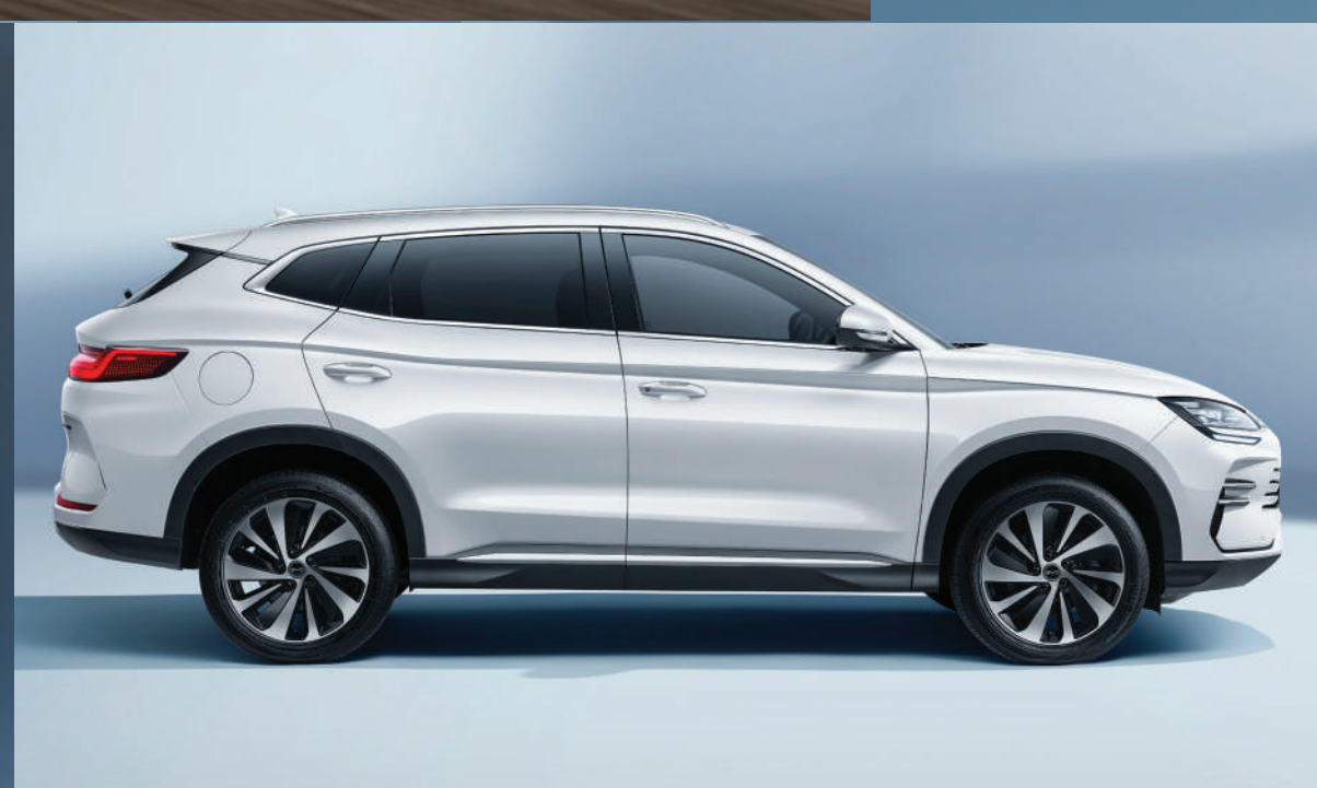
แถบอลูมิเนียมด้านข้าง เพิ่มความพรีเมียม และมิติให้ตัวรถ