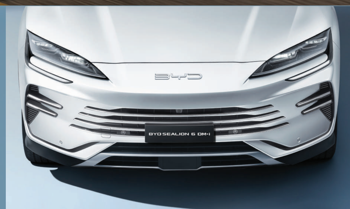
กระจังหน้า ดีไซน์โฉบเฉี่ยว ภายใต้แนวคิด BYD OCEAN SERIES

สปอร์ตพรีเมียมโดดเด่นไม่ซ้ำใคร ด้วยดีไซน์ที่เป็นเอกลักษณ์ จากแนวคิด BYD OCEAN SERIES แรงบันดาลใจจากมหาสมุทร เรียบหรู โฉบเฉี่ยว ทรงพลัง สะท้อนเสน่ห์เหนือระดับที่เป็นคุณ